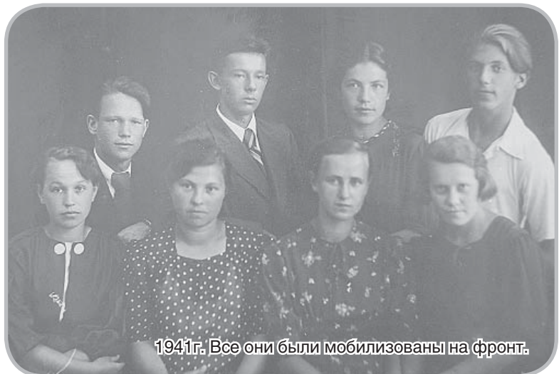
1941г. Все они были мобилизованы на фронт.

Подготовлено по материалам школьного музея.